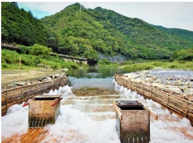
写真1 ヤナ場漁 (取材協力：みやちか)