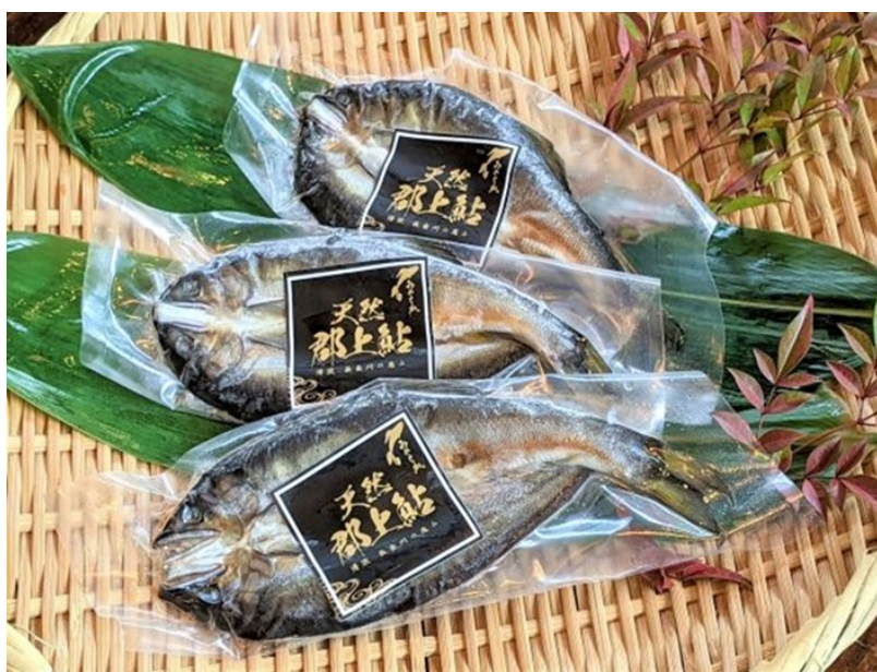
写真6 製品 （取材協力：みやちか）