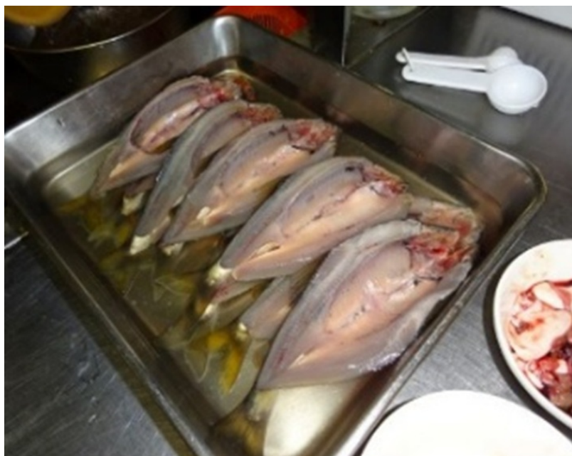
写真5 立て塩法による塩漬け （取材協力：みやちか）