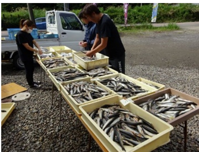
写真3 雌雄・サイズの選別 (取材協力：みやちか)