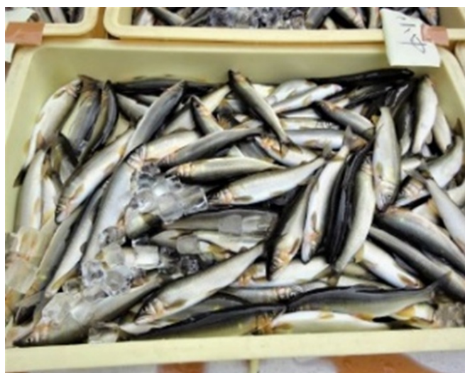
写真4 原料魚 (取材協力：みやちか)