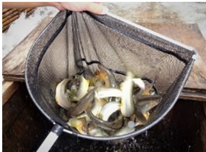
写真2 落ちアユ (取材協力：みやちか)