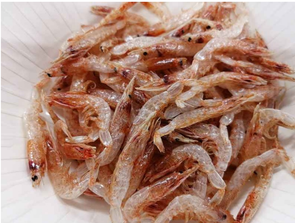
写真3 素干しさくらえび製品

そのまま食べてもよい。焼きそば、お好み焼き、チャーハン、かき揚げなどの素材のひとつとして利用されている。また、汁物や煮物ともよく合う。