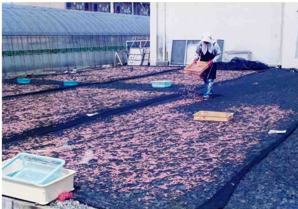
写真2 サクラエビの天日干し乾燥