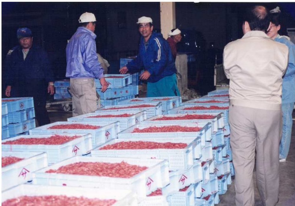
写真1 市場に水揚げされたサクラエビ