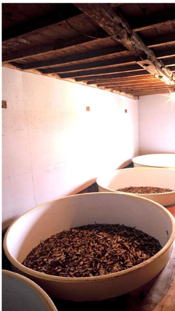
写真2 しょっつる仕込容器