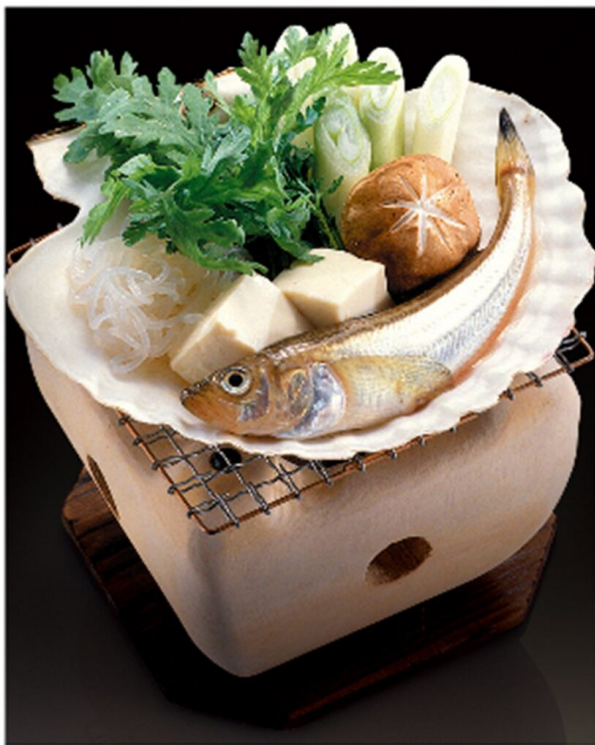
写真3 しよつつるかやき

しよつつる鍋のみならず、うどん、ラーメンのスープの味付け、鶏の唐揚げの調味液等の調味料にも適している。また、これまでにしよつつるが使用されていなかったポテトチップスなど新たな用途の拡大が期待される。