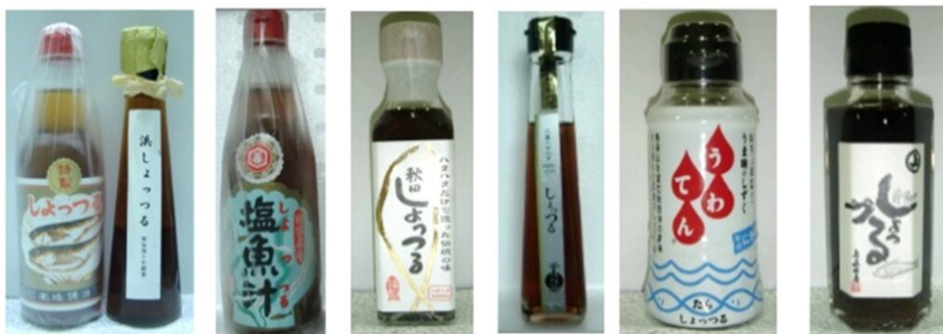
写真1 主な市販しょつつる（筆者提供）

しょつつるはいしる、いかなご醤油とともに日本の三大魚醤油の一つであり秋田県の伝統的特産品である。しょつつるは魚介類に塩を加え飽和食塩濃度に調整し腐敗を抑制しながら魚介類の持つ自己消化酵素により2年以上の時間をかけ分解し製造されてきた。したがって主成分は魚介類のタンパク質が分解したアミノ酸やペプチドであり、強いうま味と独特の魚風味が特徴の調味料である。