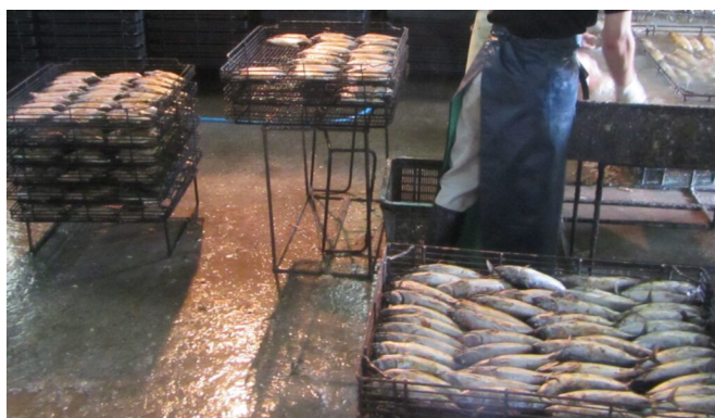
写真6 煮熟後の頭内臓除去作業