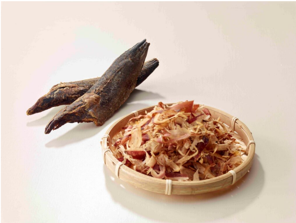
写真8 裸節