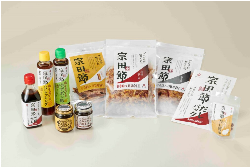
写真10 そうだ節関連商品