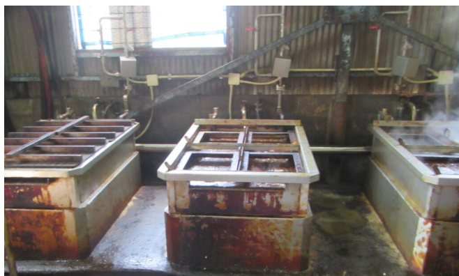
写真4 煮熟釜