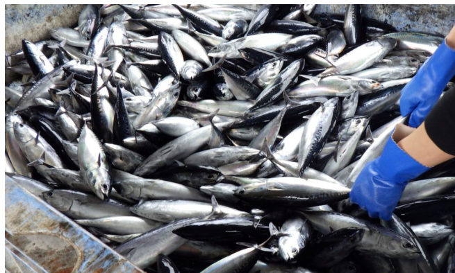
写真3 マルソウダの水揚げ