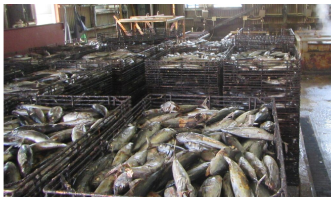
写真5 煮熟後のマルソウダ