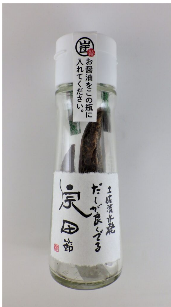
写真11 そうだ節だし醤油商品