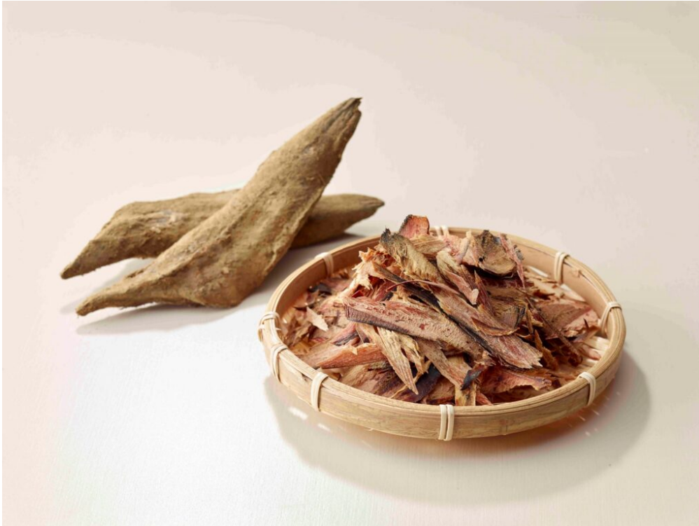
写真1 土佐宗田節(そうだ節) 枯れ節