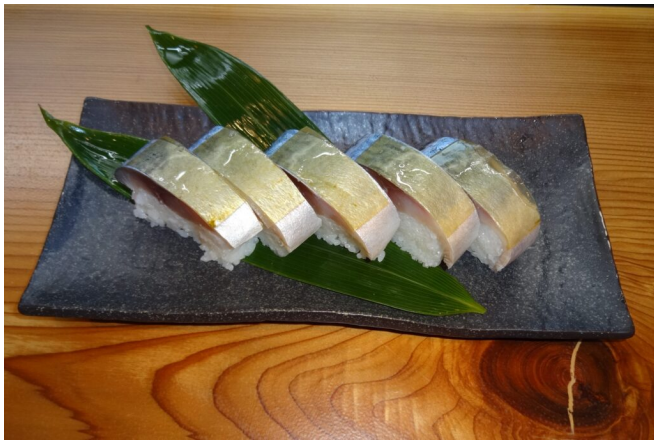
写真19 棒寿司（姿ずし