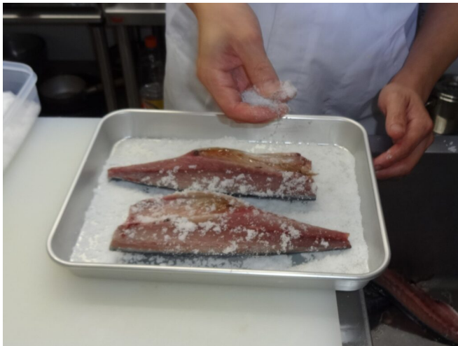
写真5 振り塩漬け作業（著者撮影）