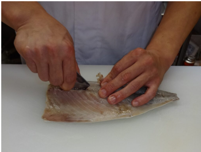
写真8 骨取り・骨抜き作業