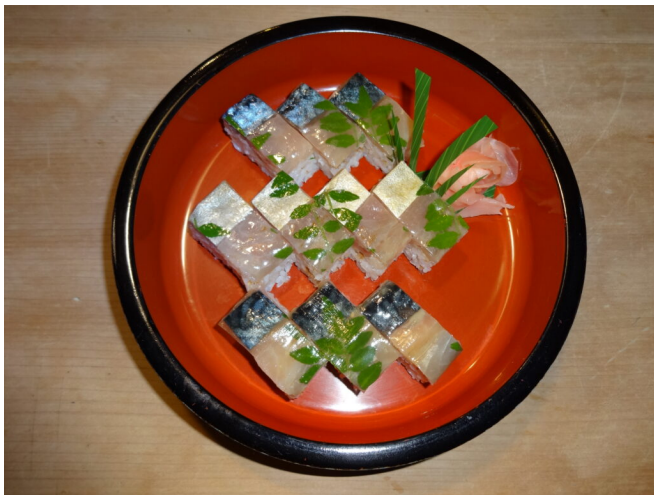
写真21 さば寿司