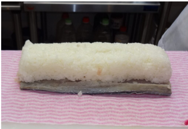
写真10 酢飯と合わせたしめさば

成型：“姿ずし”は、酢締めしたサバを解凍し、ふきんの上に身を上にして置き、棒状に固めた寿司飯を乗せてふきんと巻き簾(す)で巻き締め後、サバの皮の上に酢で煮た昆布（白板昆布）を乗せる。寿司飯は良質の米を硬めに炊き、熱いうちに砂糖、米酢、調味料を合わせ、室温まで冷ましたものを使う。