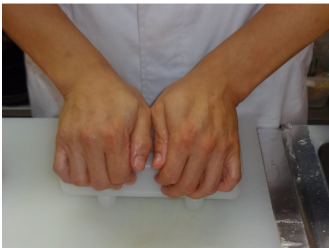
写真15 押し型での成型作業