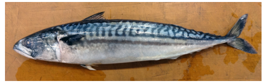
写真2 ノルウェー産の原料 タイヘイヨウサバ