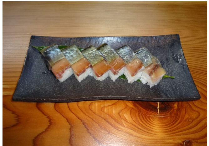
写真20 バッテラ