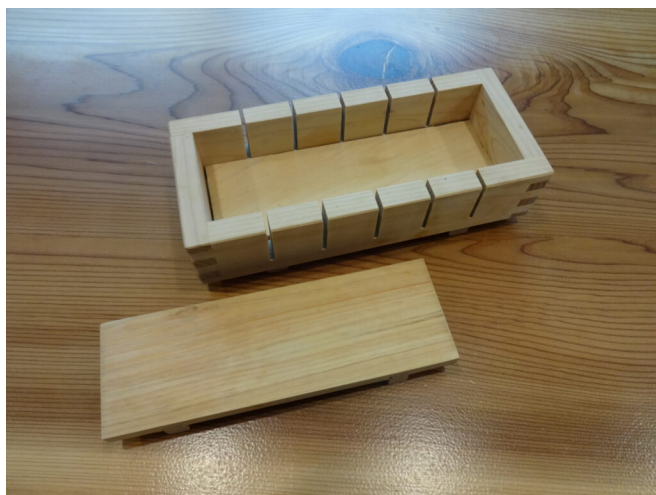
写真17 木製の押し型