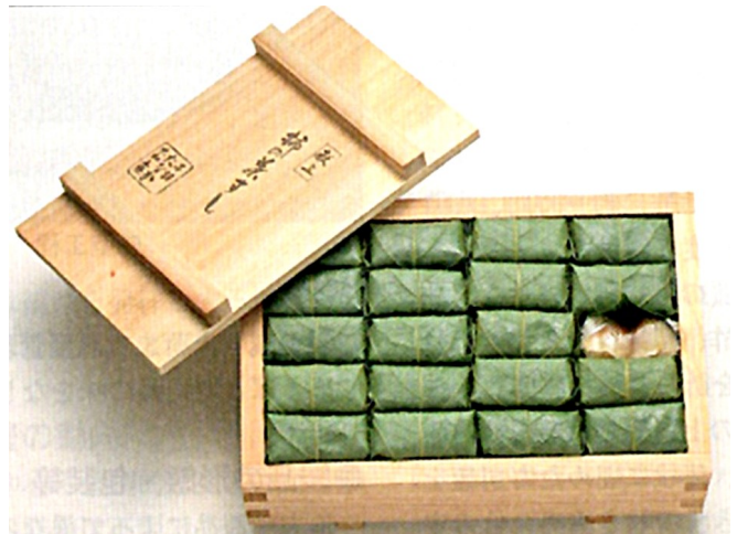
写真22 柿の葉寿司