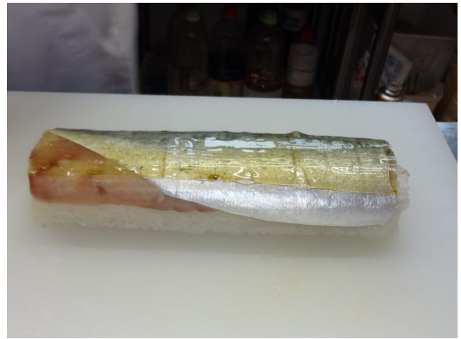
写真14 昆布締め後の姿ずし（著者撮影）

大阪のバッテラやさば寿司などの“押しずし”は、押し型に酢締めのサバの皮を下にして置き、その上に酢飯を詰め押し固めて成型する。