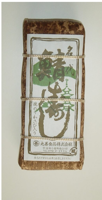
写真23 竹皮で包装したさば棒ずし（姿ずし）

冷蔵庫（特に0～3℃）に入れると寿司飯が硬くなり過ぎるため、10～5℃の涼しい所に置き、2日から3日以内に食べきるようにする。