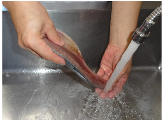
写真6 塩抜き作業

酢じめ： 米酢または米酢に砂糖、うま味調味料等を加えた合わせ酢に30分～2時間、身と皮の表面が少し白くなる程度に漬ける。