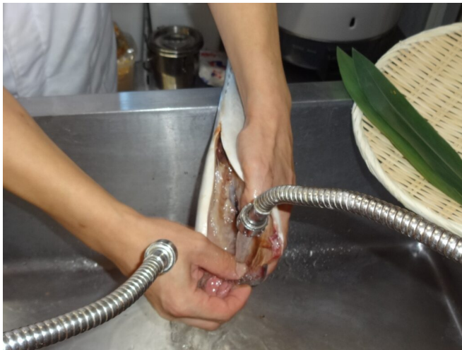
写真3 調理後の水洗い作業