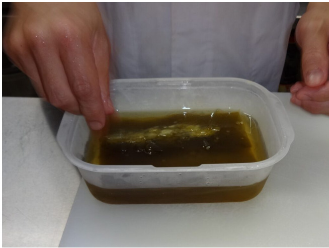
写真13 酢で煮た白板昆布