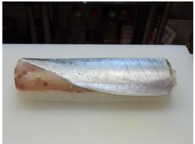
写真11 巻き簾で成型後のさば寿司