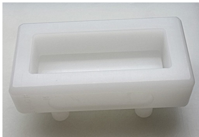
写真18 樹脂製の押し型