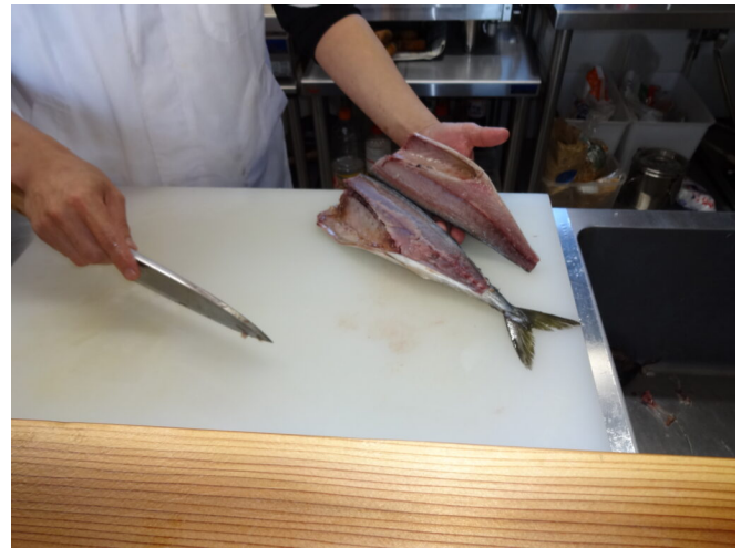
写真4 三枚卸し作業

塩漬け： 切身全体に約10%の塩を振り冷蔵庫で約1日漬込み、水で軽く洗い塩抜きし、ふきんで水気をふき取る。料理店で出す場合は、塩漬けを1時間程度に抑えるものもある。