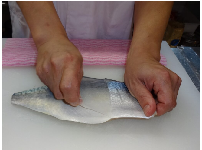
写真9 皮剥ぎ作業

冷凍： 国産の生鮮原料を用いた場合、寄生虫（特にアニサキス）の危害を防ぐため、-20℃で一晩以上凍結した後、真空包装して冷凍保存する。