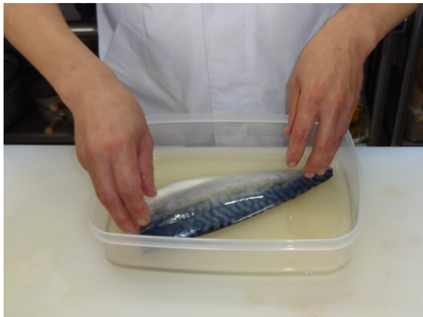
写真7 酢じめ作業

酢じめ： 米酢または米酢に砂糖、うま味調味料等を加えた合わせ酢に30分～2時間、身と皮の表面が少し白くなる程度に漬ける。